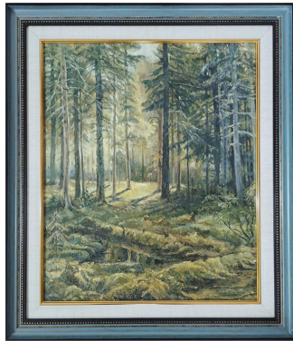
教师：樊帅君，油画，森林一角